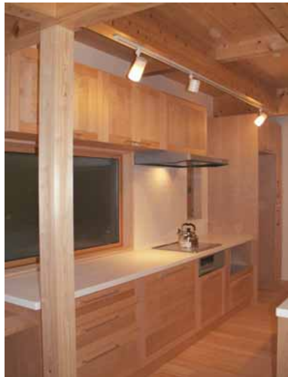
キッチン壁面収納