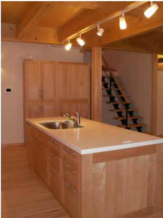
アイランドキッチン